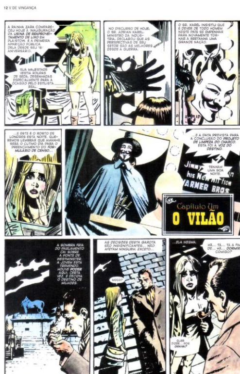
MOORE, 2012, p. 12

Na estante de V em seu covil, há algumas obras interessantes que ligam-se à trama de forma dialógica. Utopia – Optimo Reipublicae Statu Deque Nova Insula Utopia (1516) é uma obra de Tomás Moro, em que ele discute várias questões europeias, como as guerras, a censura e a pobreza. Inclusive, uma das personagens, Rafael, uma pessoa de sabedoria invejável, nega-se a trabalhar para aqueles que estão no poder, infectados pela corrupção nociva à sociedade. Para ele, suas opiniões são demasiadamente radicais. Lembremo-nos que exatamente assim são as próprias ideias de V, um anarquista. O Capital (1867) é a obra de referência para o pensamento marxista, que V leva ao extremo, cujo conteúdo é abrangente e denso. Mein Kampf (1925) funciona como um contraponto e sua expressão nazifascista vai de