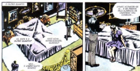
MOORE, 2012, p. 53

Equanto V invade a mansão, o pedófilo tenta persuadir a menina, que reage, esbofetando-o. Ao fazer isso, ele revela sua verdadeira face, proferindo xingamentos depravados e ameaçando-a de morte.