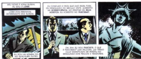
MOORE, 2012, p. 39

Na passagem em que Evey, em uma tentativa desesperada de conseguir a subsistência, tenta se prostituir, seus primeiros “clientes” são os homens-dedo (alusão ao governo nazista, um organismo com cabeça, voz, dedos etc) e eles veem-se legalmente permitidos a punir a moça : estuprá-la e depois executá-la. (MOORE, 2012, p.12-14) Nisso, aparece V, que estava em vigília e vem “fazer justiça”. Teatralmente, ele profere a fala do Sargento do Ato I, cena II, da peça Macbeth de Shakespeare, enquanto mata as “autoridades” responsáveis pela proteção do cidadão.