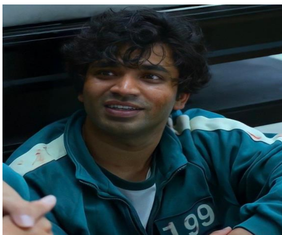
Figura 03: A anuência