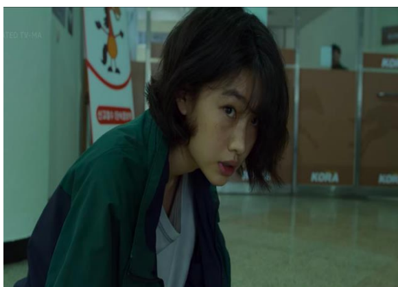
Figura 09: A indiferença