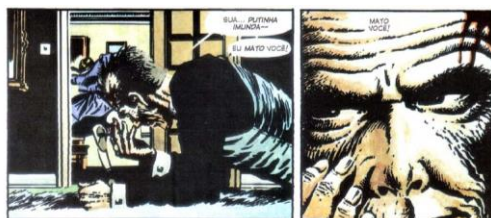
MOORE, 2012, p. 56

Trata-se de uma pessoa de aparências, que humilha e destrói as almas das meninas, as quais ele abusa. A música dos Rolling Stones , Sympathy for the Devil , que está dialogicamente implícita aqui, será intertextualmente revelada logo mais. Ao entendermos que o trecho « I've been around for a long, long year, stole many a man's soul and faith » é exatamente o que faz o religioso pedófilo, que rouba as almas das vítimas e vive em pecado, nós percebemos que a composição está intrinsecamente relacionada ao fazer-estético da passagem. A ironia maior reside no fato de que é o próprio diabo quem vem fazer a « purificação ». Podemos afirmar isto, pois V está com chifres, que aludem ao ser das trevas, ao mesmo tempo que nos remetem ao nome da música. Apesar de sabermos que o assassinato não é a solução para nenhum conflito, não há como negar que sentimos simpatia pelo V e não pelo sacerdote pedófilo. Sympathy for the Devil . Há, portanto, uma subversão, uma desconstrução da ideia religiosa.