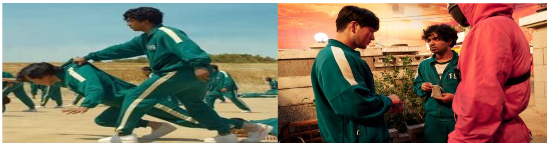
Figura 06: A trapaça