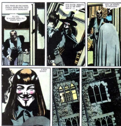
MOORE, 2012, p. 56

Perceba a ironia no uso do profano para purificar a santidade, representada na figura do clérigo. Eis o trecho agora citado: “ Please allow me to introduce myself, I’m a man of wealth and taste ”. Aqui temos a intertextualidade em sua definição mais clássica: uma relação entre textos, entre materialidades. Ela é um tipo específico de dialogismo. Observe como a passagem é primorosamente construída: ele está apresentando-se ao sacerdote ( Please allow me to introduce myself ) e, em uma espécie de espelhamento, reflete o que o sacerdote é, um homem de riqueza e bom gosto, pois quando Evey entrou no quarto dele, percebeu a decoração exemplar e todo o requinte do ambiente.