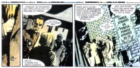
MOORE, 2012, p. 13

“Força através da pureza, pureza através da fé”, foi assim que Moore sintetizou a essência fascista em sua obra. A busca por um ser humano mais forte e perfeito, por uma pureza racial absurdamente errática, aliada a uma fé, uma força invisível que consegue modificar o comportamento das pessoas com facilidade, fazendo-as perder o senso crítico, dando origem a uma nova sociedade pautada na autoridade, na disciplina e na fé. Faz-nos lembrar o pensamento nazista da pureza da raça ariana que, aliada ao Cristianismo (Igreja Católica) e contra o Judaísmo, transformaram a ideologia racista em algo também religioso (de fé). Duas ideias amalgamadas e dialógicas. Para ajudar nessa cosmovisão, Moore alia imagens, como a saudação nazista, e frases expressivas, como “Inglaterra triunfa !”,