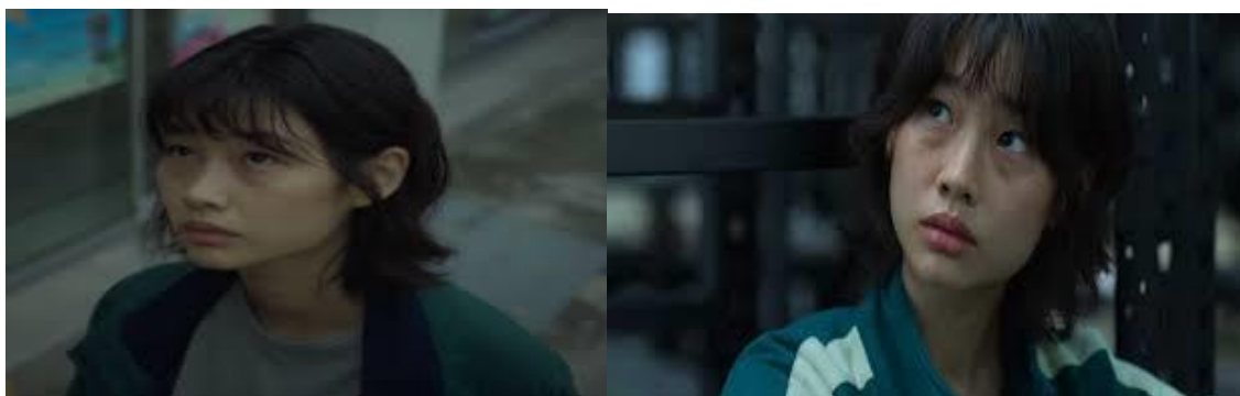
Figura 08: A inferioridade