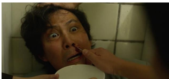
Figura 01: A dívida