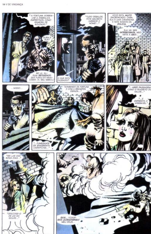
MOORE, 2012, p. 14

Eis outra passagem importante para mostrar o fazer estético de Moore pelo viés dialógico. Um sentido profano é percebido, quando o mascarado V apresenta-se ao sacerdote pedófilo para assassiná-lo. (MOORE, 2012, p. 56) Antes disso, porém, há uma intersecção de duas narrções, uma mostrando Evey, disfarçada de adolescente enviada para satisfazer a fornicação do religioso e outra com V nas imediações da mansão do clérigo.