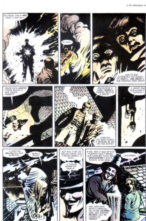
MOORE, 2012, p. 15

V alude a Fausto, como em “Sim, acho que podemos fazer um pacto” (MOORE, 2012, p. 46), cita Henrique VIII de Shakespeare, como em “Ó beldade, até hoje eu te desconhecia” (MOORE, 2012, p. 43) e utiliza outros artifícios para transformar a narração em uma colcha de retalhos, sem permitir que isto comprometa o discurso, pelo contrário, sem esse trabalho do narrador-personagem, a costura do texto não aconteceria.